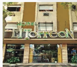
HOTEL EL TORREON